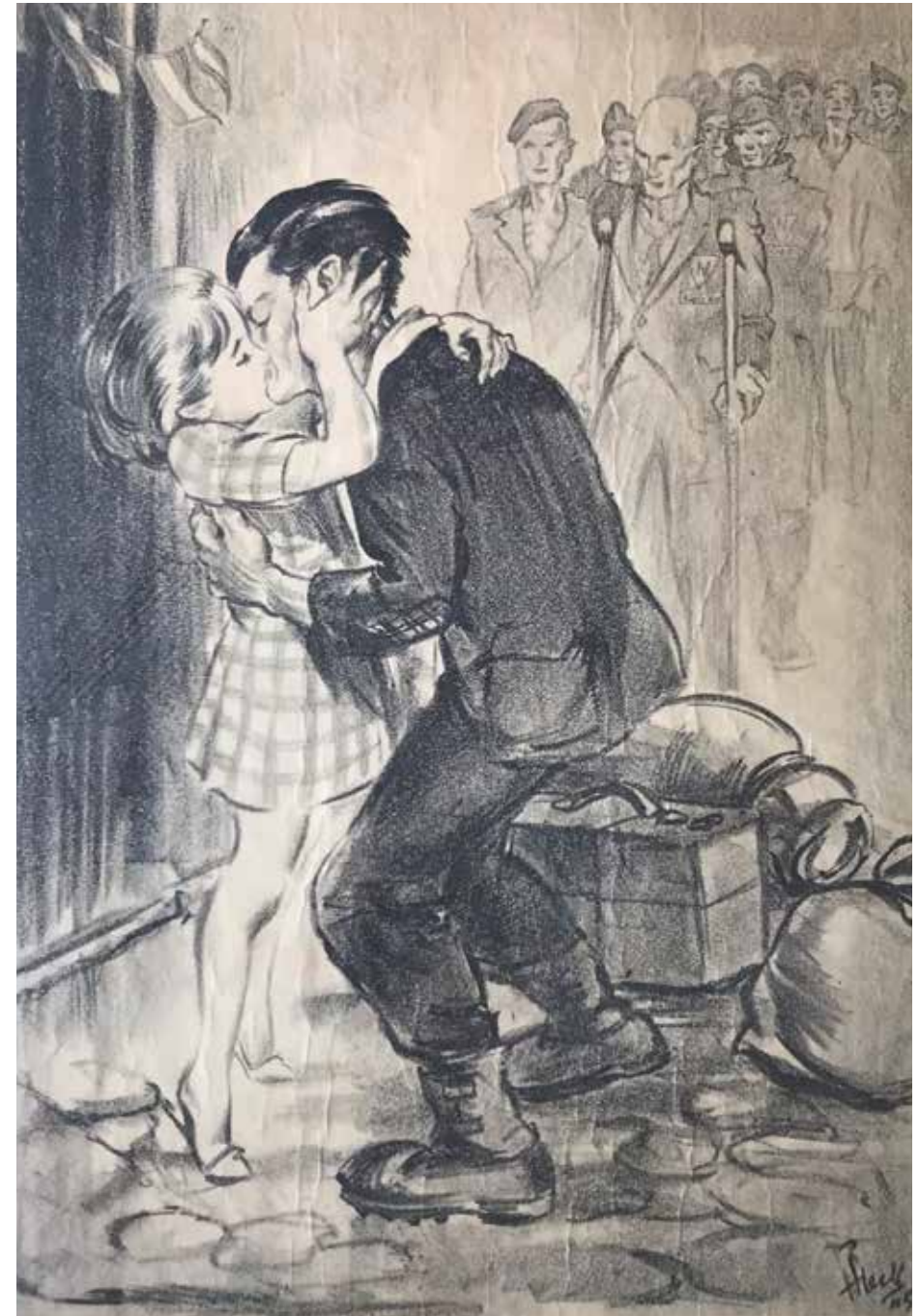
'De thuiskomst', houtskooltekening. (Coll. fam. E. van Broekhoven-Proost, Bergen op Zoom)