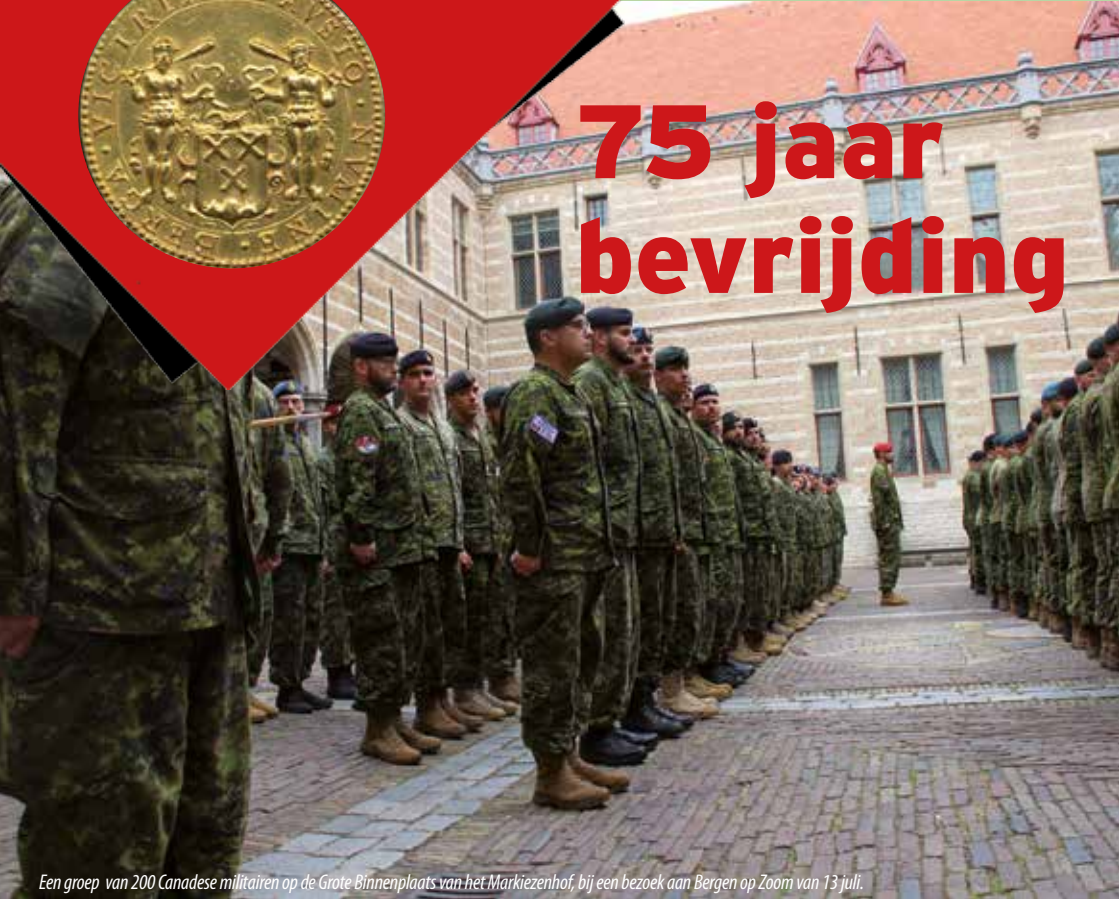
Een groep van 200 Canadese militairen op de Grote Binnenplaats van het Markiezenhof, bij een bezoek aan Bergen op Zoom van 13 juli.